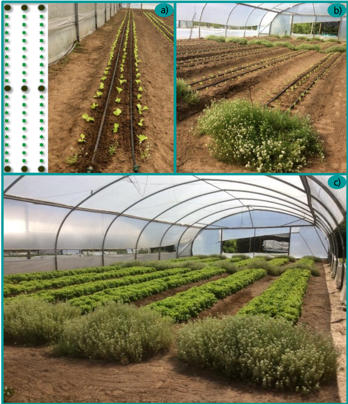
➤ Figura 4. Diseño de incorporación de las plantas de aliso en el camellón de cultivo (a) y desarrollo de las plantas a los 4 (b) y 6 meses después de la implantación (c).