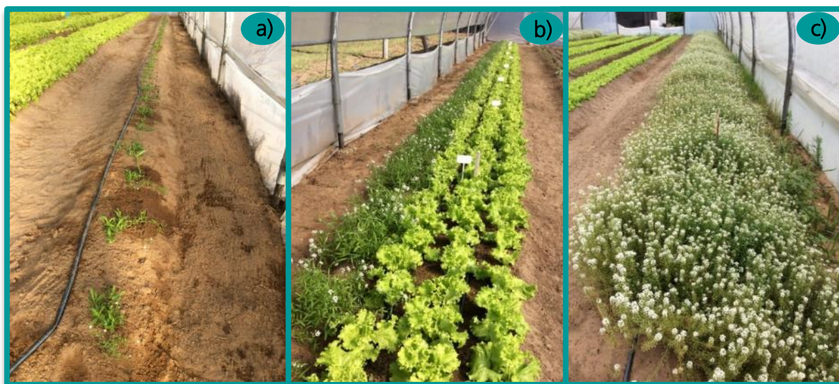
➤ Figura 3. Corredor de aliso instalado en un invernadero productivo en el mes de marzo (a) y su evolución a los 4 y 8 meses posteriores al trasplante (b y c)

Con el propósito de no restar superficie productiva al invernadero es posible realizar el corredor con la “planta insectario” utilizando los zócalos del mismo o entre los postes con los que son sostenidas algunas estructuras, siempre teniendo en cuenta de no interferir con las labores de la maquinaria.