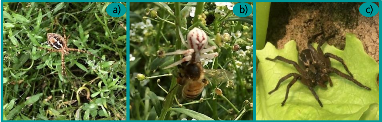
➤ Figura 7. Arañas que utilizan el follaje de aliso como refugio. a. araña tejedora de tela, Argiope trifasciata (Fam. Araneidae), b. araña cangrejo (Fam. Thomisidae) alimentándose de una abeja, c. "araña lobo" (Fam. Lycosidae) sobre planta de lechuga.