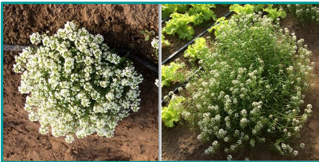
➤ Figura 1. Plantas de aliso de diferentes variedades y portes

• Es una planta de bajos requerimientos en cuanto al mantenimiento, aunque es conveniente realizar podas de rejuvenecimiento para prolongar la floración sostenida y el vigor de la planta.