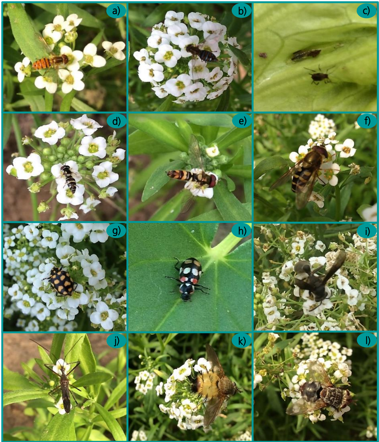
➤ Figura 5. Diversidad de visitantes florales de aliso. Depredadores: a. Adulto de “mosca de las flores” Toxomerus duplicatus y b. Toxomerus watsonii (Fam. Syrphidae), c. Larva de Toxomerus duplicatus alimentándose del pulgón Uroleucon sonchi (Fam. Aphididae) en lechuga. d. Adulto de “mosca de las flores” Allograpta exotica y e. Allograpta obliqua (Fam. Syrphidae), f. Adulto de “mosca de las flores” Syrphus ribessi (Fam. Syrphidae), g. Adulto de las vaquitas Colleomegilla quadrifasciata y h. Eriopis connexa (Fam. Coccinellidae), i. Adulto de la avispa Polybia sp. (Fam. Vespidae), j. Adulto de la chinche (Fam. Nabidae). Parasitoides: k,l. Adultos de la familia Tachinidae.