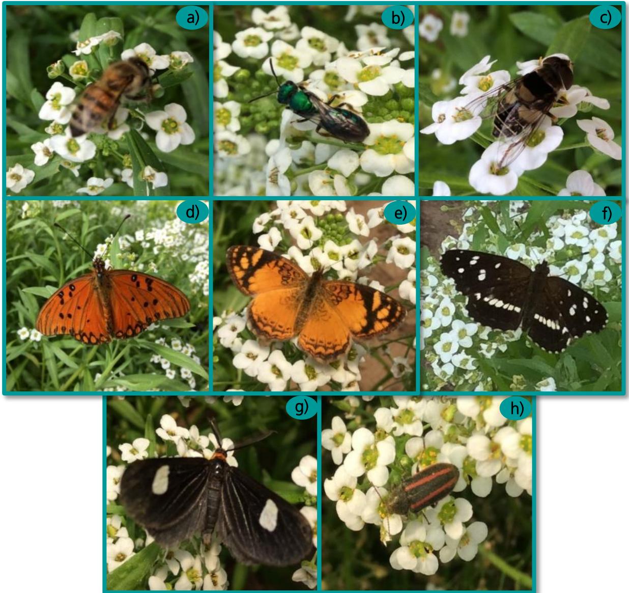
➤ Figura 6. Visitantes florales del aliso con función polinizadora. a. Apis mellifera "abeja melífera" (Fam. Apidae), b. Augochlora phoemonoe "abeja metálica" (Fam. Halictidae), c. Eristalis sp. "mosca de las flores" (Fam. Syrphidae) d. Agraulis vanillae "mariposa espejito" (Fam. Nymphalidae), e. Tegosa orobia "mariposa incienso" (Fam. Nymphalidae), f. Ortilia ithra "mariposa bataraza" (Fam. Nymphalidae), g. Melanchroia aterea (Fam. Geometridae), h. Astylus vittaticollis "astilo" (Fam. Melyridae).